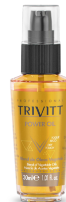
Fluido Para Escova